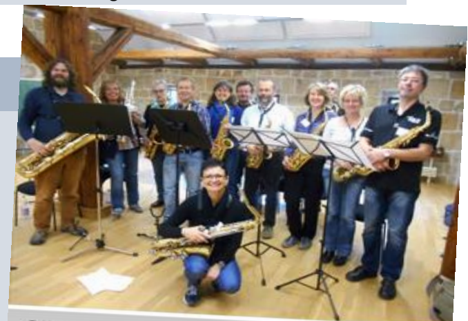
Ob Neuling oder Wiederholungstäter - Wir sind eine tolle Gruppe!

Jetzt schnell oben Zimmer aussuchen und anmelden. Sonst könnte es zu spät sein.