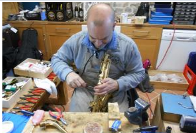
Wahrlich ein absoluter Meister auf seinem Gebiet! Unser ToKo!

Nach dem Frühstück am Donnerstag geht's es zum Aufwärmen und dann in die Intensivkurse. Diese Kurse treffen sich alle Tage und studieren immer in der gleichen Zusammensetzung. So übt ihr ein oder gleich mehrere Stücke für das große Abschlusskonzert am Samstag. Möchtest du an dem Intensivkurs bei Toko teilnehmen, melde das bitte auf dem Anmeldeformular gleich mit an. Dort gibt es nur 7 Plätze. Bei Toko wird gehandwerkelt und nicht gespielt. Aber wer weiß, was dabei schönes rauskommt.